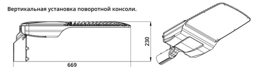
Угол регулировки поворотной консоли \pm 20^\circ с шагом 5^\circ .