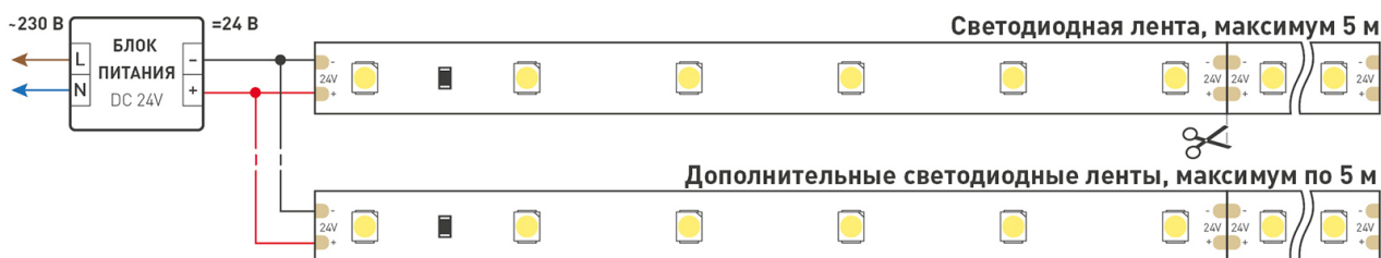
Схема 1. Подключение нескольких светодиодных лент с одной стороны.

Максимальная длина подключения ленты – 5 м (1 катушка).